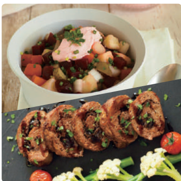
クリスマス料理 〈ロソリ&ブルーベリー入りミートローフ〉