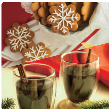
クリスマスデザート 〈ジンジャークッキー&(ノンアルコール)グロッグ〉